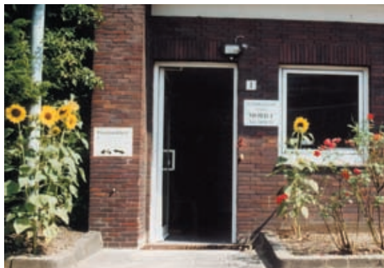
Eingang der Praxis in Bochum

Nach der Bewilligung des Antrages ist die heilpädagogische Förderung für die Eltern kostenlos.