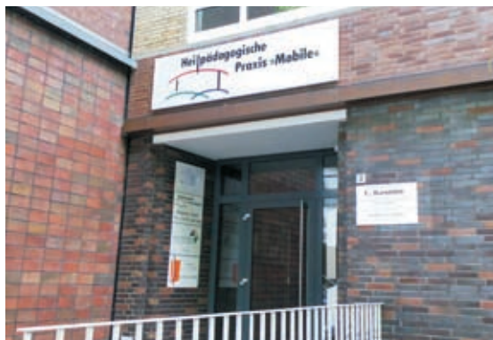
Eingang der Praxis in Herne-Wanne